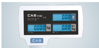
Hinterleuchtete Anzeigen auf Bediener- und Kundenseite mit Abschaltautomatik