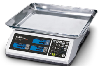
Warenschale ideal für lose Waren – 360×280×55 mm