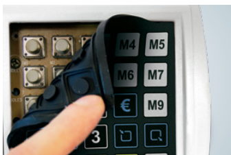
Leichtgängige mechanische Tasten unter der wasserabweisenden Softtouch-Tastaturmatte garantieren ein präzises, ermüdungsfreies Bedienen